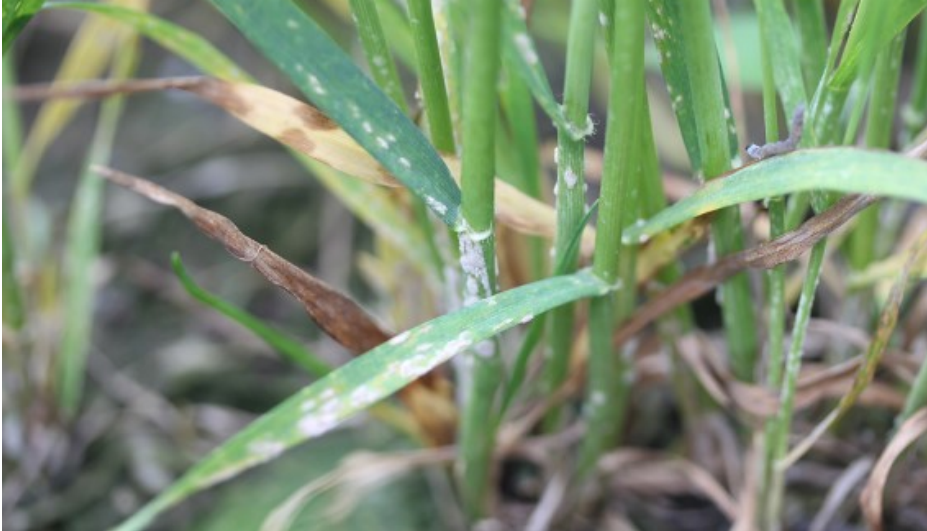
Billede 4. Samme som billede 3. Meldug i hvedesorten Torp fotograferet 15. maj 2017.