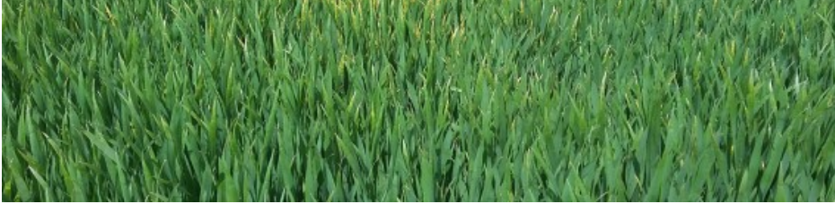
Billede 1. "Rede" af gulrust i hvedesorten Benchmark ved Åbenrå. Fotograferet 11. maj 2017 af Mogens Munk, LandboSyd.